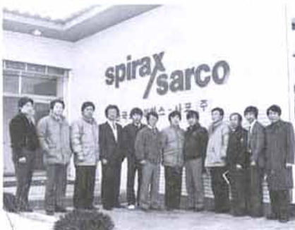
에너지관리공단 진단방문공방방문세미나 (1987. 2. 3)