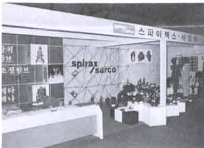
'87 전시회 (1987. 9. 8-9. 17)

이와 같은 모든 행사는 고객여러분의 당사에 대한 아낌없는 지원아래 이루어진 것이라고 믿고 있으며 그에 대한 보답으로 스파이렉스-사코는 신년도에도 계속하여 새로운 프로그램으로 고객서비스를 강화하여 나갈 것을 약속드립니다.