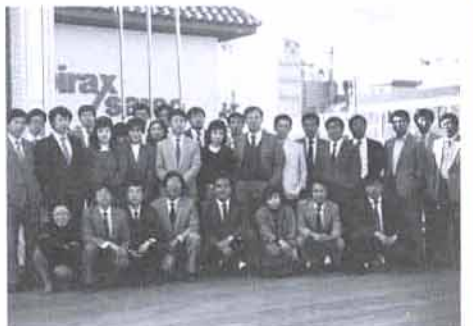
현대건설설비설계팀 공장방문세미나 (1987. 11. 3)