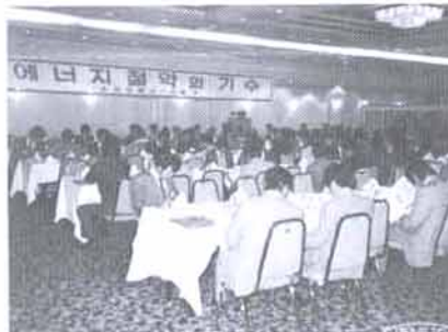
대전지역세미나 (1987. 3. 6)