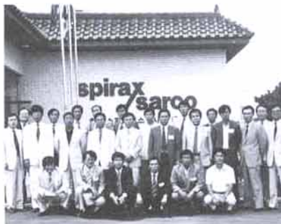
제8711회 증기실무연수교육 특별과정 (1987. 9. 11)